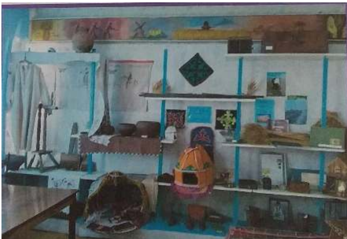
Экспонаты школьного музея