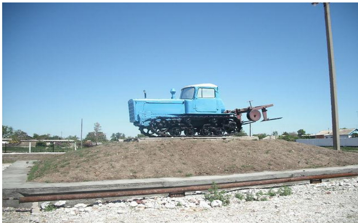
Гусеничный трактор времен целины