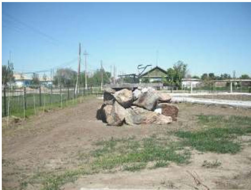
Первый плуг целины