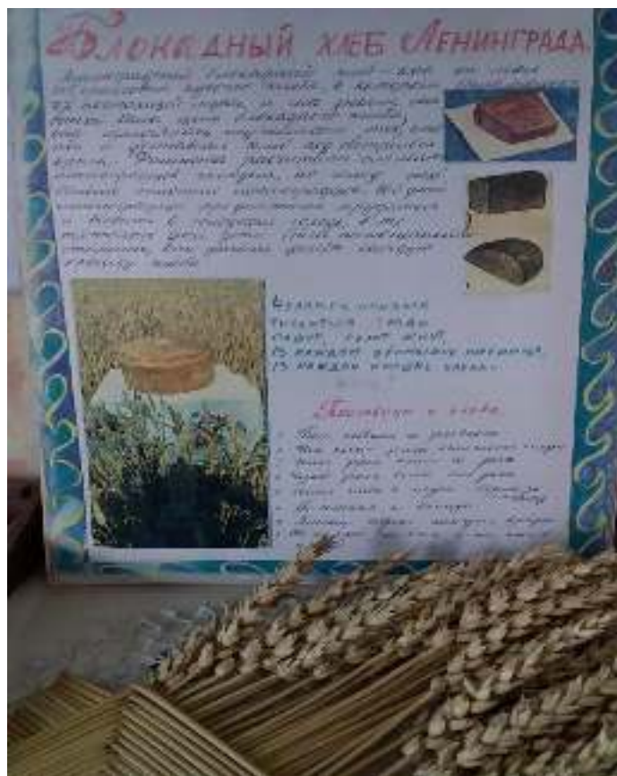
В 1982 в Запорожской средней школе был открыт «Музей Хлеба»