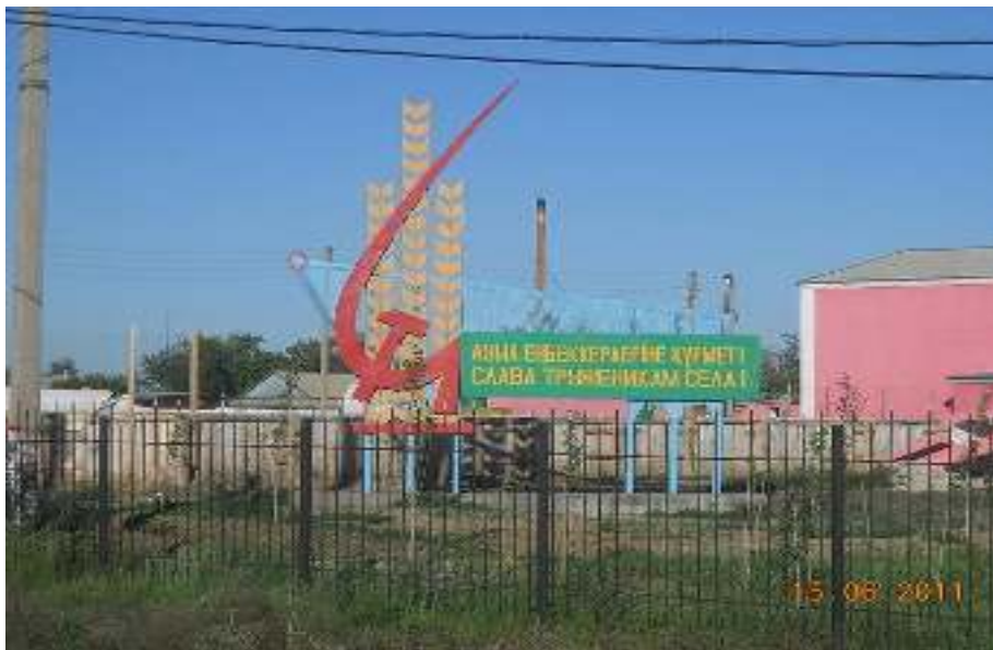
Парк славы первоцелинникам

С большой любовью в нашем селе построен новый парк, посвященный трудовой славе земледельцев – парк Славы первоцелинникам. Аллеи, тротуары, зона отдыха для запорожской детворы и взрослых. На пьедестале поставлен гусеничный трактор времен целины, первый плуг и символическая повозка переселенцев – основателей нашего села.