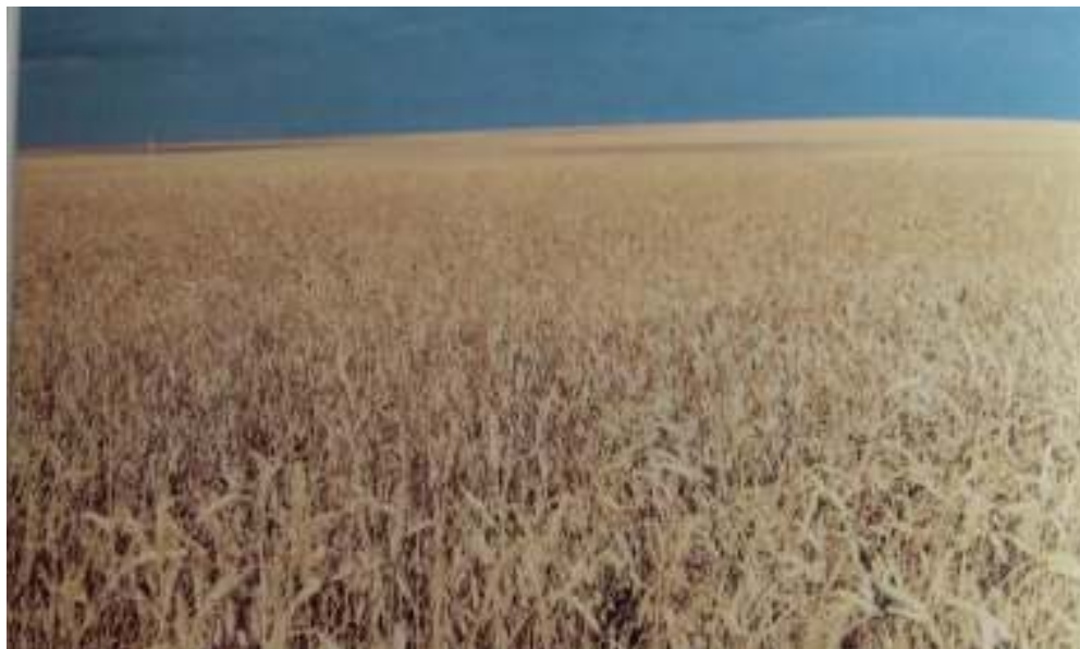
Хлебные поля земли Запорожской сегодня